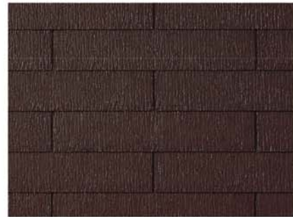
●GK121* ココナッツ・ブラウン