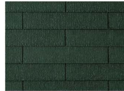
●GK247* アイリッシュ・グリーン

耐震性 地震に強い 軽量瓦です。地震の際にも住まいの躯体にかかる負担が小さくて済みます。